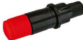
PHP33-CB15 (Cuchillas CB15)