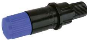
PHP33-CB09 (Cuchillas CB09)