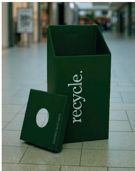
VERDE BOTELLA 4 MM 1.22 X 2.44 M