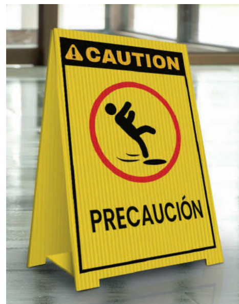
AMARILLO 4 MM 1.22 X 2.44 M