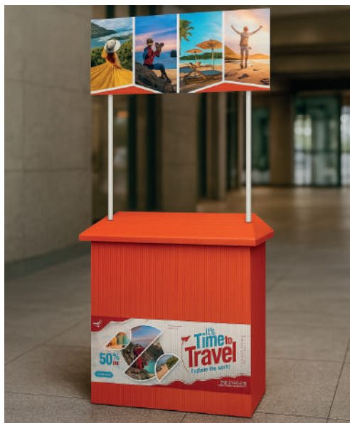
NARANJA 4 MM 1.22 X 2.44 M

Espesor: 4 mm y 5 mm Tintas: UV y serigrafía