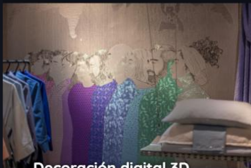
Decoración digital 3D