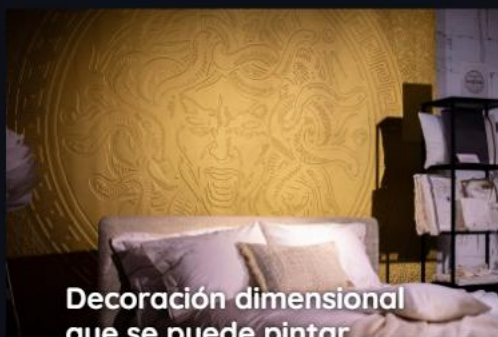
Decoración dimensional que se puede pintar